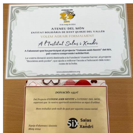
Certificat de la seva donació