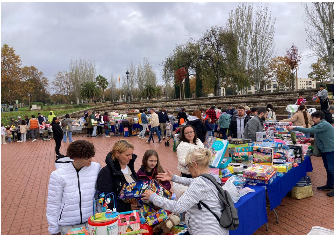
El parc s'omple de joguines