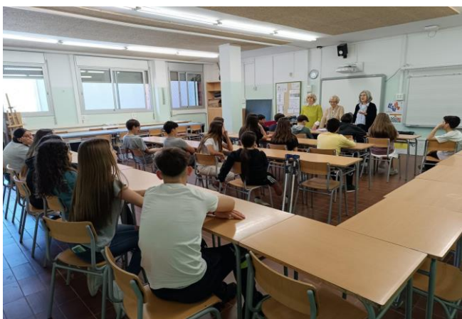
Una visita a l'escola Salas i Xandri

Un altre grup en el taller de cuina, com a projecte dins de la setmana "Be engaged in your world", han fet les Galetes solidàries, les han venudes i han recaptat 120,-€ que en fan donació a l'Ateneu del Món.